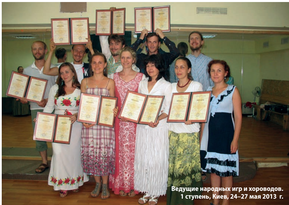
Ведущие народных игр и хороводов. 1 ступень, Киев, 24–27 мая 2013 г.

Заявки на участие присылайте на адрес: nika.sky@mail.ru или ВКонтakte http://vk.com/id10735870 .